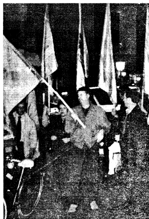
Alcuni momenti della manifestazione di mercoledì in piazzetta della Lega del Sap che rientra in una campagna promossa a livello nazionale "Chi difende i difensori?"

IL PICCOLO Giornale di Alessandria e Provincia