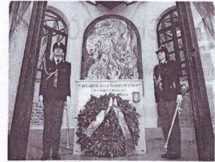
Il sacrario dedicato a tutti i morti caduti in servizio della polizia