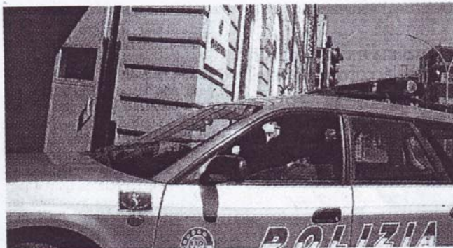
La Questura è alle prese con i tagli ai finanziamenti: le auto da riparare restano ferme

E' scroto Rizzo: «A luglio avevamo fatto una manifestazione intitolata: "Ridiamo la pantera alla città" e il questore aveva recepito il messaggio. Ora a fine mese ne faremo un'altra all'insegna di "Chi difende i difensori?" e i logo sarà un pugno che si abbatte sulla pantera». Poi spiega come si è giunti a questa situazione: «Il problema, certamente è nazionale, ma ad Alessandria siamo in emergenza. La progressiva riduzione delle forniture e degli interventi di riparazione fino a raggiungere la decisione di non farli proprio più, a meno che non si tratti di piccole cose, ha portato a una drastica e progressiva riduzione del parco auto».