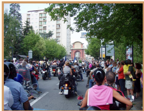
64° Motoraduno "Madonnina dei Centauri"